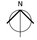
02 PLANTA DE ZONEAMENTO PAVIMENTO TÉRREO ESCALA 1:200